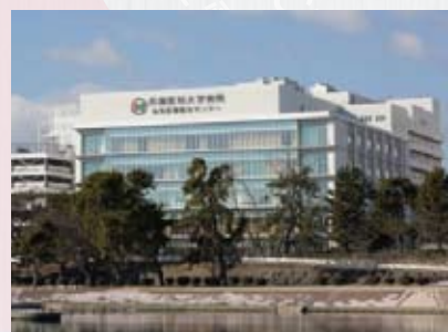
阪神電車武庫川駅 西出口スグ