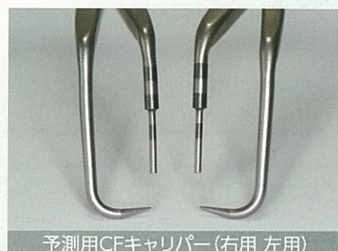
予測用CFキャリパー(右用 左用)