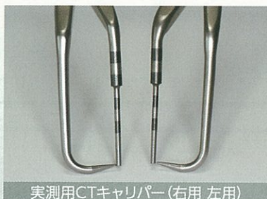
実測用CTキャリパー(右用 左用)